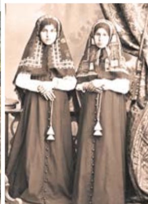
Скитницы семеновских лесов. XIX в. Семеновский уезд Нижегородской губернии