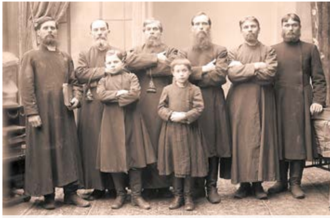
Группа старообрядцев-поморцев. Нижний Новгород