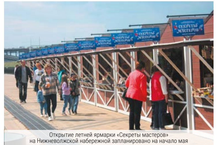
Открытие летней ярмарки «Секреты мастеров» на Нижневолжской набережной запланировано на начало мая

ниры, но и узнать больше об историческом наследии, обогатить свои знания о народных художественных промыслах и научиться создавать изделия НХП своими руками.