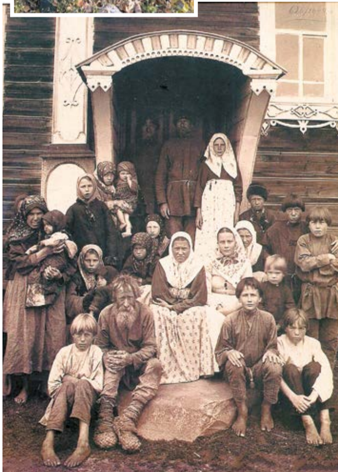
Группа старообрядцев. Деревня Кузнецово Семеновского уезда